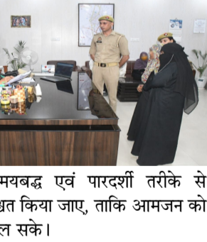
आधार पर समयबद्ध एवं पारदर्शी तरीके से निस्तारण सुनिश्चित किया जाए, ताकि आमजन को त्वरित न्याय मिल सके।

लिए बेहद हर्षपूर्ण रहता है क्योंकि आज संकट मोचन हनुमान जी का जन्म उत्सव है। जोकि जगह-जगह हनुमान चालीसा सुंदरकांड हवन कीर्तन, भंडारे आदि धार्मिक कार्य बड़े ही भक्ति भाव से किए जाते हैं।