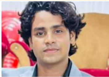
मृतक युवक का फाइल फोटो

घाट पर घूमने गया था जहां वह नहाने लगा तभी बाकी दोस्तों ने पुलिस को बताया कि वह जब पानी से काफी समय तक तक बाहर नहीं आया तब आनंद फलन में वह घबरा गए और उन्होंने मामले की जानकारी परिजनों को दी तब परिजन पुलिस प्रशासन के साथ पहुंचे