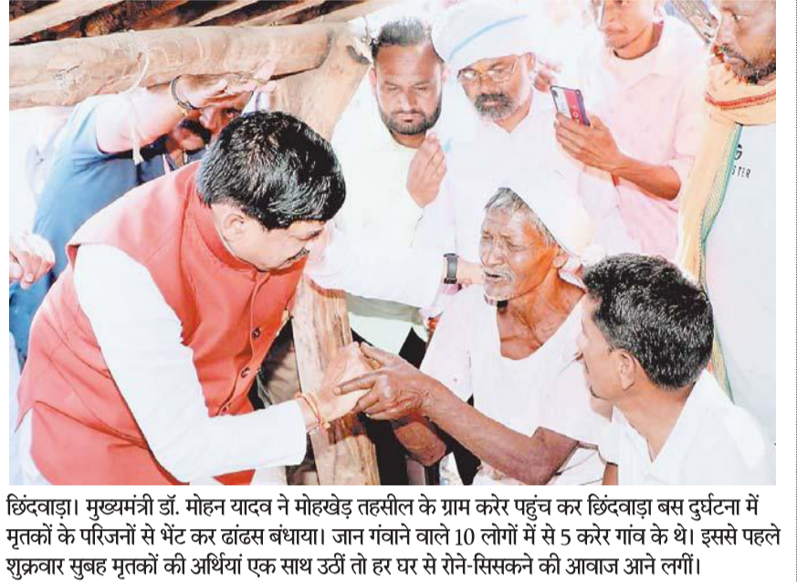
छिंदवाड़ा। मुख्यमंत्री डॉ. मोहन यादव ने मोहखेड़ तहसील के ग्राम करेर पहुंच कर छिंदवाड़ा बस दुर्घटना में मृतकों के परिजनों से भेंट कर ढांडस बंधाया। जान गंवाने वाले 10 लोगों में से 5 करेर गांव के थे। इससे पहले शुक्रवार सुबह मृतकों की अर्धियां एक साथ उठीं तो हर घर से रोने-सिसकने की आवाज आने लगी।