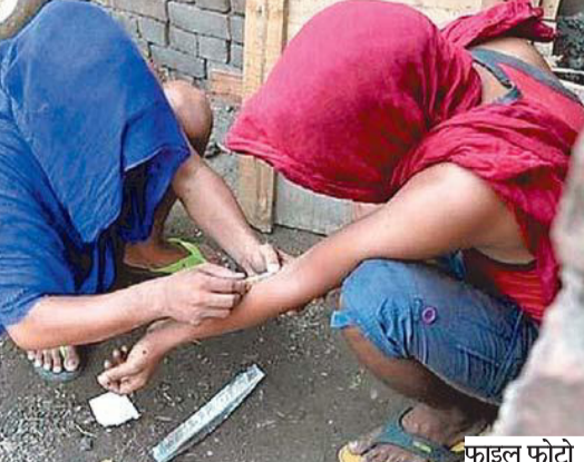
खतरनाक पदार्थों का हो रहा उपयोग

और सबसे चिंताजनक बात यह है कि इसकी चपेट में छोटे-छोटे मासूम बच्चे आ रहे हैं। रेलवे स्टेशन से लेकर शहर के विभिन्न गली-मोहड़ों में कबाड़ बीनते बच्चे खुलेआम सुलोचन जैसे सस्ते नशे का सेवन करते दिखाई दे रहे हैं। इन बच्चों के हाथ में एक कपड़ा या रुमाल होता है, जिसमें नशे वाला पदार्थ लगा होता है और उसी को सूंघकर वे नशे की गिरफ्त में आ जाते हैं। इन 5 स्थानों पर भी दिखाई देते हैं नशा करते बच्चे