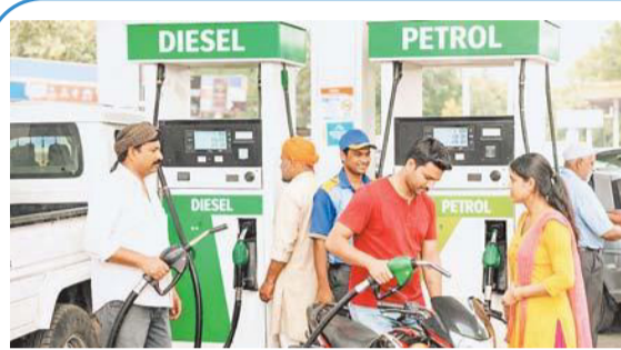
60 दिन का ईंधन भंडार सुरक्षित, केंद्र सतर्क

सरकार ने स्पष्ट किया है कि इस टैक्स कटौती का सीधा लाभ उपभोक्ताओं को कीमतों में कमी के रूप में तुरंत नहीं मिलेगा। दरअसल, पेट्रोल-डीजल के खुदरा दाम तेल कंपनियों तय करती हैं। ऐसे में यह राहत ऑयल मार्केटिंग कंपनियों को उनके बढ़ते घाटे से उबारने के लिए दी गई है। पिछले कुछ समय से अंतरराष्ट्रीय कच्चे तेल की कीमतों में लगभग 50 प्रतिशत तक बढ़ोतरी हुई है, जबकि भारत में खुदरा कीमतें स्थिर रखी गई थीं। इससे कंपनियों को पेट्रोल पर करीब 24 रुपये और डीजल पर 30 रुपये प्रति लीटर तक का नुकसान हो रहा था।