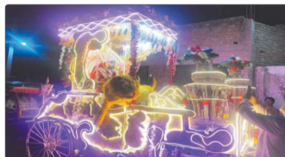
फरिहा में निकलती मां दुर्गा की शोभायात्रा में सम्मिलित झांकी।

दर्जनों स्थानों पर पुष्प वर्षा कर किया गया स्वागत स्वदेश समाचार फरिहा