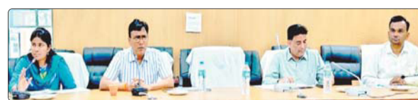
समीक्षा बैठक में निर्देश देते जिलाधिकारी अंजनी कुमार सिंह।

समीक्षा बैठक में जिलाधिकारी अंजनी कुमार सिंह ने व्यवक्त की नाराजगी