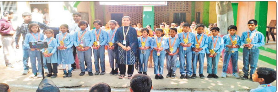
कालेश्वर विद्या मंदिर में आयोजित कार्यक्रम में सम्मानित मेधावी विद्यार्थी।

कस्बे के प्रमुख शिक्षण संस्थान श्री कालेश्वर विद्या मंदिर में शनिवार को एक भव्य सम्मान समारोह का आयोजन किया गया। इस गौरवमयी कार्यक्रम में विद्यालय के मेधावी छात्र-छात्राओं के साथ उनके अभिभावकों को भी सम्मानित कर उनकी उपलब्धियों का उत्सव मनाया गया। समारोह के दौरान उत्कृष्ट शैक्षणिक प्रदर्शन करने वाले विद्यार्थियों को विद्यालय प्रबंधन द्वारा प्रशस्ति पत्र और विशेष