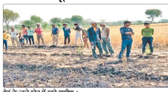
गेहूं के जले खेत में खड़े ग्रामीण।