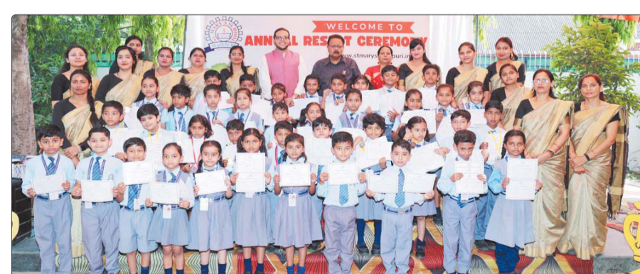
परीक्षा परिणाम के साथ छात्र-छात्राएं।