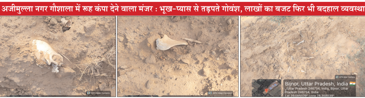
अजीमुल्ला नगर गोशाला में रूह कंपा देने वाला मंजर : भूख-प्यास से तड़पते गोवंश, लाखों का बजट फिर भी बदहाल व्यवस्था