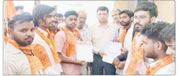
तहसीलदार को ज्ञापन देते हिंदू रक्षा दल के पदाधिकारी।