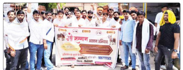
गौ संरक्षण की मांग को लेकर गौसम्मान आह्वान यात्रा निकरते गौ सेवक।

गौ सम्मान आह्वान यात्रा एका नगर के मुख्य बाजार स्थित गांधी मूर्ति से प्रारंभ होकर जसराना तहसील परिसर पहुंची। महाहिम राष्ट्रपति, प्रधानमंत्री, मुख्यमंत्री एवं अन्य वरिष्ठ प्रशासनिक अधिकारियों को संबोधित ज्ञापन के माध्यम से क्षेत्र में निराश्रित गौवंश के उचित संरक्षण, चारे की व्यवस्था और गौशालाओं की स्थिति में सुधार लाने की