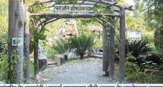
पतंजलि के महामंत्री आचार्य बालकृष्ण पौड़ी जनपद के यमकेश्वर ब्लाक स्थित माला गांव के धन्वतरि धाम में।

पर किए गए अध्ययन में सकारात्मक परिणाम मिले, जिसके बाद राज्य के कई जिलों में किसानों और निजी संस्थाओं ने इस मॉडल को अपनाया शुरू कर दिया। विशेषज्ञों के अनुसार चंदन एक अर्ध-परजीवी वृक्ष है, जिसकी वृद्धि के लिए अन्य पौधों की जड़ों से पोषण आवश्यक होता है। इसलिए इसकी खेती वैज्ञानिक पद्धति और उचित प्रबंधन पर निर्भर करती है। इसी क्रम में उत्तरप्रदेश के