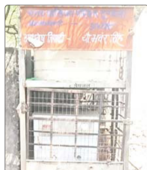
शोपीस बना वाटर कूलर।

नगर पालिका परिषद द्वारा आम जनता की सुविधा के लिए विभिन्न स्थानों पर लगाए गए वाटर कूलर इन दिनों शोपीस बनकर रह गए हैं। नगर के अधिकांश प्रमुख स्थानों पर लगे कूलर खराब पड़े हैं और एक भी सही तरीके से कार्य नहीं कर रहा। मुख्य रूप से नगर के सुभाष चौराहे पर लगभग बीते दो वर्षों से एक भी वाटर कूलर नहीं लगा है। भीषण गर्मी में शीतल पेयजल की व्यवस्था न होने से राहगीरों, मजदूरों और व्यापारियों को भारी परेशानी का सामना करना पड़ रहा है। लोगों को पानी के लिए इधर उधर भटकना पड़ रहा है। स्थानीय नागरिकों का आरोप है कि लाखों रुपये खर्च कर लगाए गए इन कूलरों के रखरखाव पर ध्यान नहीं दिया जा