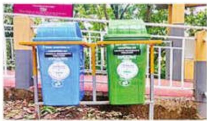
Urban Green Revolution

North Lakhimpur in Assam has become a standout example of scientific waste management under Swachh Bharat Mission-Urban 2.0, turning decades of environmental neglect into a model of urban renewal. The North Lakhimpur Municipal Board cleared 79,000 metric tonnes (MT) of legacy waste from the Chandmari dumpsite. The intervention freed 16 bighas of land, with another 10 bighas now set to be transformed into an Urban Forest and Urban Retreat Zone. The revival of the nearby Sumdiri River has further restored local biodiversity, bringing back birds, fish, and aquatic life.