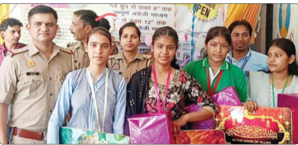
मुख्य अतिथि द्वारा सम्मानित छात्राएं।