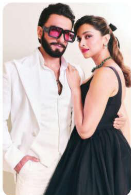
accompanying them during this outing.

Deepika opted for a relaxed yet chic look, dressed in an oversized royal blue outfit paired with night glares, while Ranveer sported a casual ensemble. As soon as the power couple arrived, onlookers at the airport were seen visibly excited, gathered around and quickly started to record the Ranveer and Deepika. Their daughter Dua was not seen